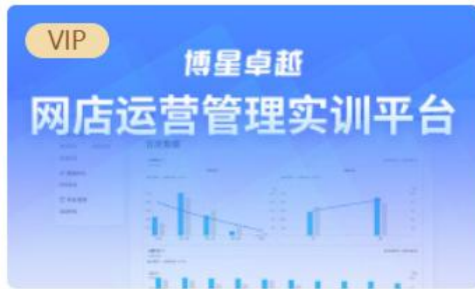
网店运营管理实训平台

教师账号进入应用后，自动登录控制端，在控制端中，有比赛设置、比赛专区、成绩专区三个大目录，每个目录下有对应的小模块。